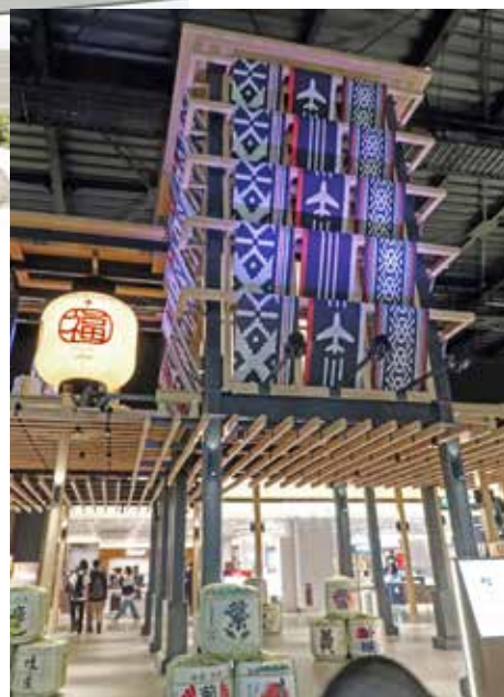
福岡空港国際線：免税店エリアの中央に福岡をイメージした「YAGURA」

福岡市民ホールのオープン、福岡空港国際線のリニューアルに伴い、バリアフリーチェック活動を行いました。